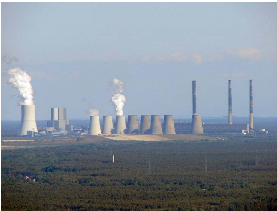
Abbildung 3: Braunkohlekraftwerk in Boxberg