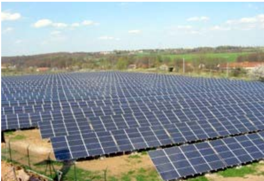
Abbildung 4: Erneuerbare Energien – Fotovoltaik bei Merane