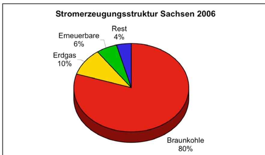
Abbildung 1: Energieträger für Stromerzeugung

Die Stromerzeugung erfolgt zu etwa 80% auf der Basis von Braunkohle ergänzt durch etwa 10% Erzeugung auf Gasbasis (Energieversorgung in Sachsen, statistischen Landesamt 2008). 6% des Stromes wird auf der Basis erneuerbarer Energiequellen gewonnen. Zwischen 1998 und 2006 konnte der Beitrag der erneuerbaren Energien um den Faktor 6 gesteigert werden (Umweltbericht 2007, SMUL).