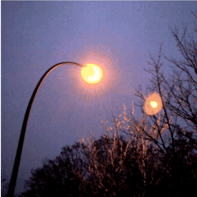
Abbildung 7: Effiziente Natrium-Dampf Lampe