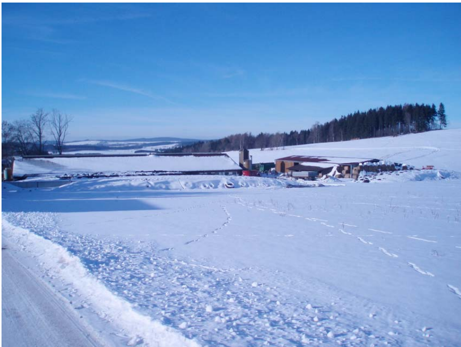
Abbildung 6: Nachhaltige Landwirtschaft integriert in die Landschaft

Die Ergebnisse werden durch die SAENA in Kooperation mit den Stakeholdern (SLB) verbreitet. Hier sind Verfahren und Aufwand noch festzulegen. Die HTW will das Projekt wissenschaftlich begleiten. Hierbei ist auch an den Einsatz von Studenten zur Durchführung von Fallstudien gedacht.