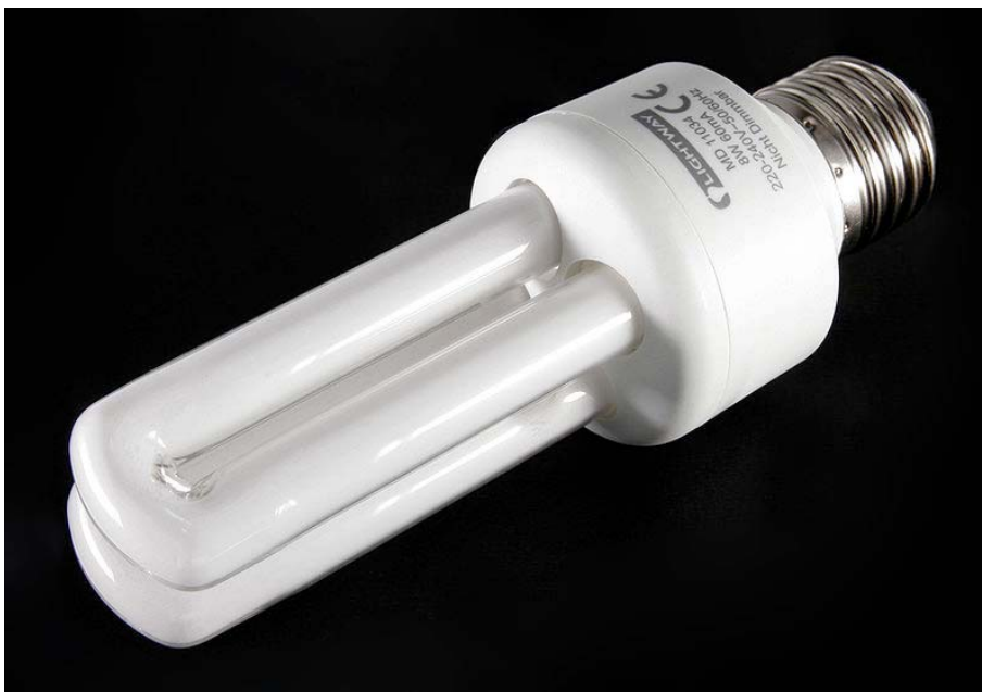
Abbildung 5: Kompaktleuchtstofflampe (KLL)

Trotzdem reagieren die privaten Haushalte zurückhaltend auf diese Chance zur Steigerung der Energieeffizienz auf Grund alter Vorurteile. In Übereinstimmung mit den europäischen Plänen zur Abschaffung von Glühlampen ist jetzt ein guter Zeitpunkt, Kompaktleuchtstofflampen zu fördern. Verschiedene Stakeholder, die Hersteller, Einzelhändler und Landesregierung können in dies Projekt eingebunden werden. Die Aktion wird durch die SAENA koordiniert. Umweltminister des Landes Sachsen und der sächsische Hersteller Narva haben die Projektpläne gebilligt. Die Baumarktkette Toom fördert das Projekt ebenfalls.